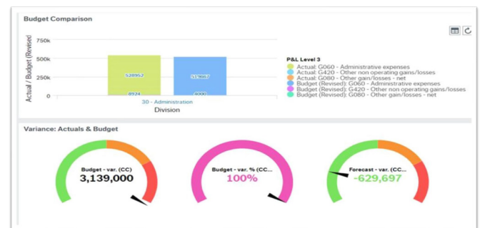
Budget - actuals comparison 1